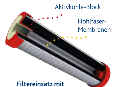
Filtereinsatz mit Hohlfaser-Membran